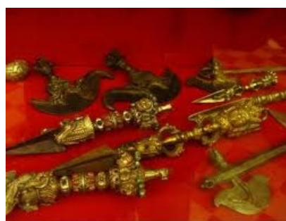
Pignali rituali Parika e Kavri

La musica religiosa è presente nelle numerose cerimonie che scandiscono la vita quotidiana dei nepalesi. I testi religiosi vengono sempre accompagnati da un'orchestra formata da tamburi di coccio, piatti d'ottone e corni di bufalo. Il ritmo è scandito dai piatti, che hanno le dimensioni di piccoli sottobicchieri e sono legati tra loro da una cordicella.